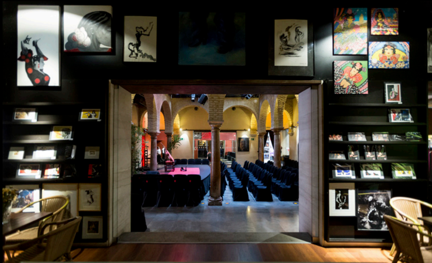
En un edificio del siglo XVIII totalmente reformado y equipado, el Museo del Baile Flamenco se encuentra en pleno Barrio de Santa Cruz, en el centro histórico de Sevilla.